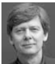
Af René Bühlmann

Skoleåret er startet, og dermed er der taget hul på gymnasie- og hf-reformen. For de kolleger, der har 1.g- og 1.hf-klasser og nye VUC-hold, er der en række nye udfordringer at tage op: almen studieforbereelse, almen sprogforståelse, screening, studieplaner, nye læreplaner og vejledninger og nye arbejdsformer for blot at nævne de mest iøjnespringende.