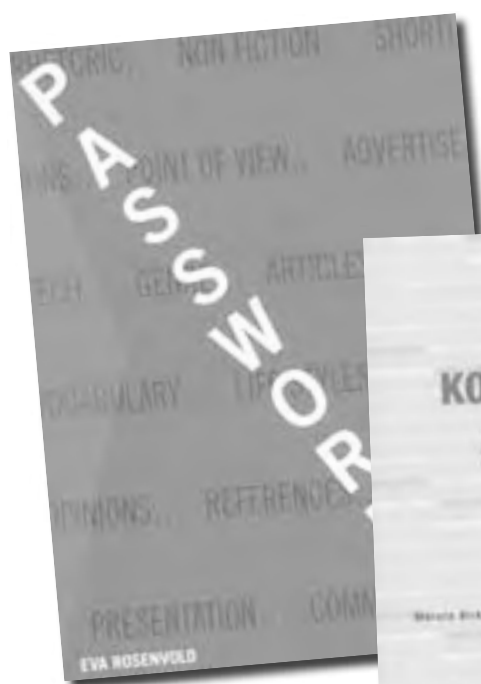
Passwords Systeme 2005 Af Eva Rosenvold

I dette nummer er følgende anmeldt eller omtalt: